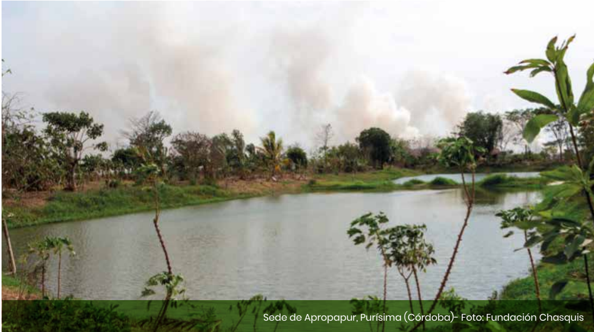
Sede de Apropapur, Purísima (Córdoba)

Uno de los principales objetivos de la iniciativa 'Transformemos Territorios Construyendo Paz' en Colombia es fortalecer el trabajo de la Academia en las comunidades que actualmente afrontan conflictividades por la tierra y el territorio. Para tal fin, diseñó un plan estratégico para aportar al país una red conformada por cinco observatorios regionales que incluyan esta temática en sus investigaciones.